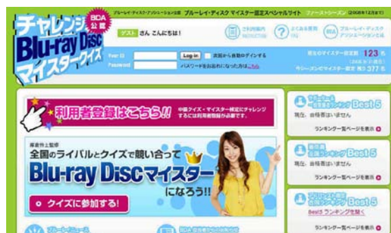
「ブルーレイディスク マイスタークイズ」画面イメージ

BDA ではこのようなご要望にお応えし、「ブルーレイディスクに詳しい店員さんがいる店舗ランキング」として、スタッフの方の合格人数/回数をもとにポイントを算出し、その上位店舗の中間発表を本日オフィシャルサイト上で行いました。また来年 1 月には「ブルーレイディスク マイスター」がどこの店舗に在籍しているかを簡単に検索できるサービス「あなたの近くのマイスターがいるお店(仮称)」も開設し、よりユーザーの方々が「ブルーレイディスク マイスター」取得者に関する情報を入手しやすい環境を整備していきます。