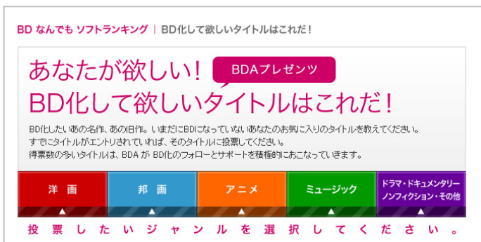
「あなたが欲しい！BD 化して欲しいタイトルはこれだ！」 画面イメージ

価格：24,990 円(税込/振込手数料・送料込)、発売：2010 年 3 月 26 日頃発送予定