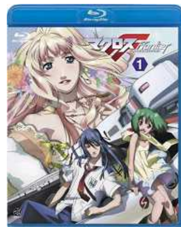
「マクロス F」1巻 ジャケット

「マクロス F」は人気アニメシリーズ「マクロス」誕生25周年を記念して制作されたTVアニメで、最新の3DCGを駆使した映像がTV放映当時から話題となりました。特に迫力のある戦闘シーンはアニメファンのみならず航空機ファンからも支持を得ており、これらの高品質な映像をBDの高画質・高音質な環境で楽しみたいという消費者のニーズが今回のヒットに繋がりました。