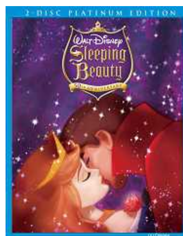
「眠れる森の美女/プラチナ・エディション」ジャケット

今後も消費者の皆様にはHD映像の世界を楽しんでいただくべく、新作のみならず過去の名作においても多くのBDソフトがリリースされていく予定ですので、ご期待ください。